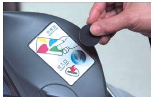
▲捷運新蘆線自動收費系統工程包括現有車站系統更新，目前Token及門檔式開門都已上線營運。

通在自動收費系統領域的一大進展，過去我們只能擔任專業分包商的下包，現在我們已經取得專業分包商的資格，可以直接承攬捷運自動收費系統工程。感謝丸紅商社及台北捷運局對神通能力的認同，我們會全力以赴，建置一個最好的系統。