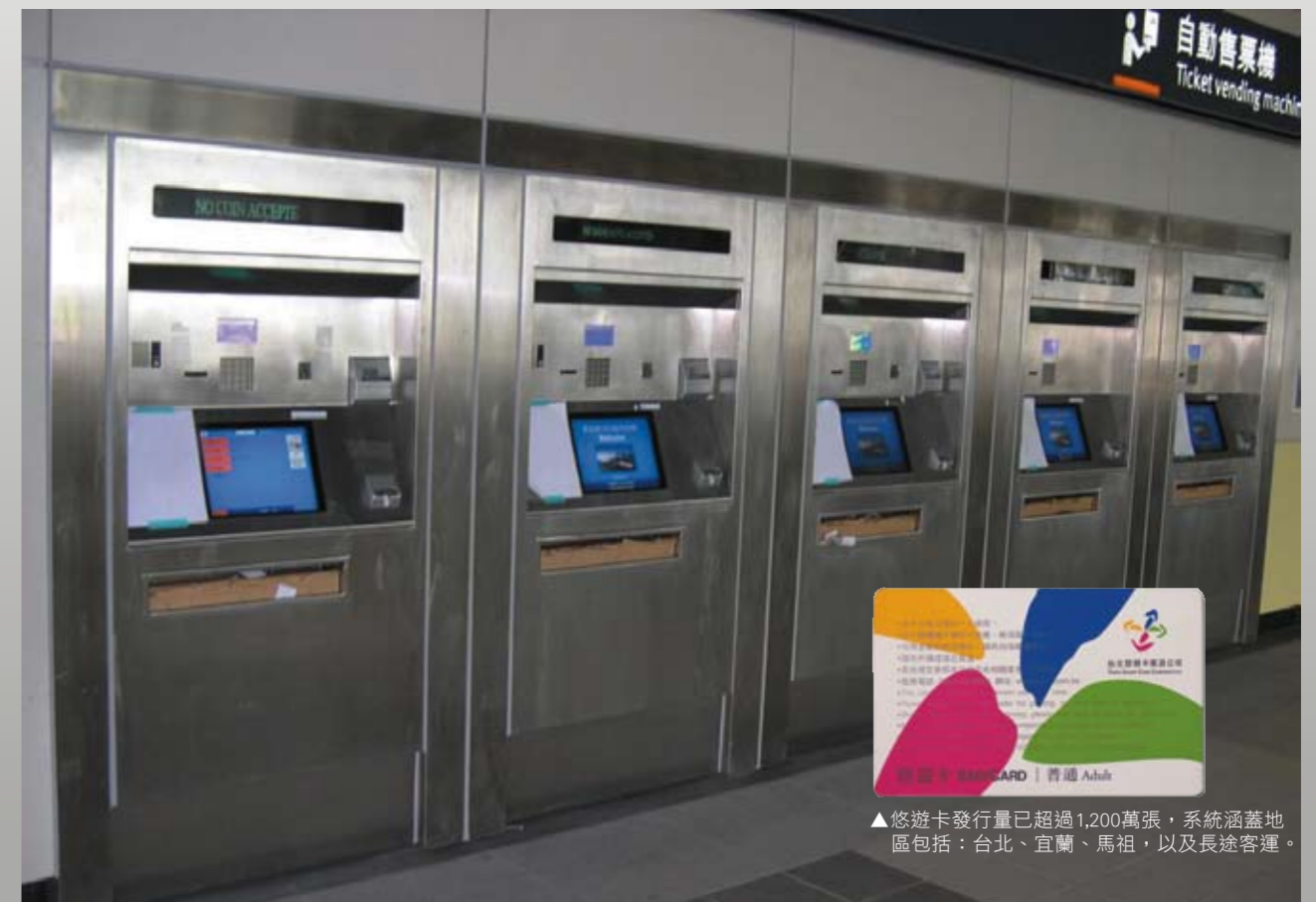
▲悠遊卡發行量已超過1,200萬張，系統涵蓋地區包括：台北、宜蘭、馬祖，以及長途客運。

了捷運系統的品質；高鐵乘客已突破2,300萬，票務系統也已由現場購票擴大至語音、網路購票，穩定性逐步提高。未來我們希望將觸角延伸至台北地區以外的捷運系統，並且複製台灣成功的經驗到亞洲地區，成為此一領域的佼佼者。■